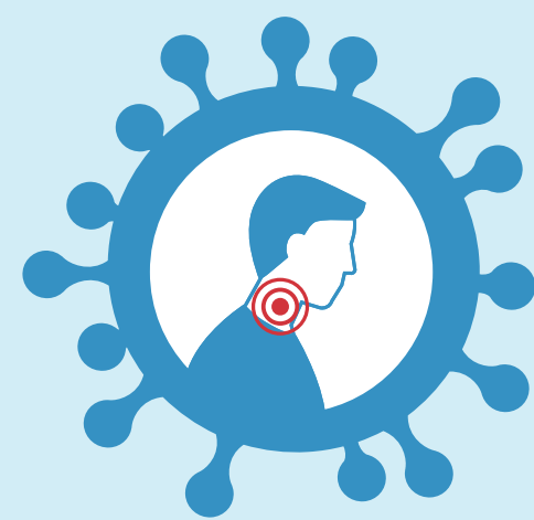
Maux de gorge