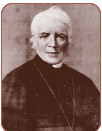
Mgr Ignace Bourget