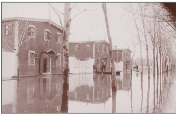
Inondation de 1895