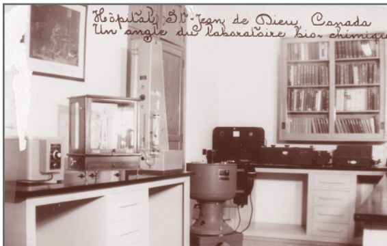
Où Fernand Seguin donnait ses cours