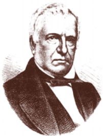
Sir Louis Hippolyte Lafontaine