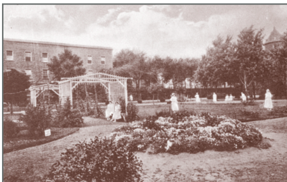
Hôpital Saint-Jean-de-Dieu — Terrain de jeux des gardes-malades