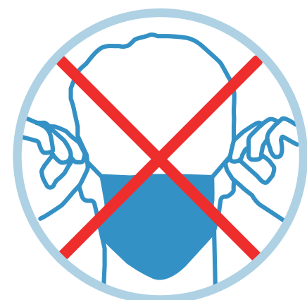
Équipement de protection individuelle (ÉPI)